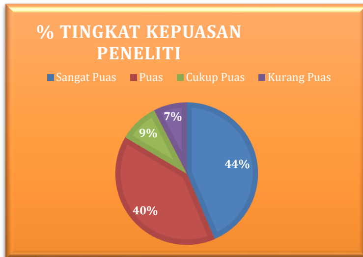
Garafik 3.2. Presentasi Tingkat Kepuasan

Hasil analisis menunjukkan bahwa seluruh indikator memiliki nilai rata-rata yang sama, yaitu: